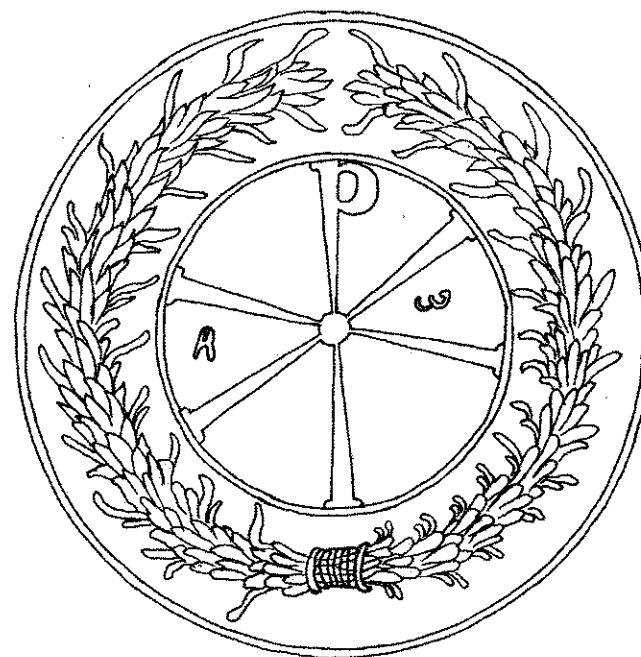
Ниш, Гробница са сидром, Константинов монограм, цртеж арх. М. Диманић Niš, Crypt with an anchor, Constantine's monogram, drawing arch. M. Dimanić